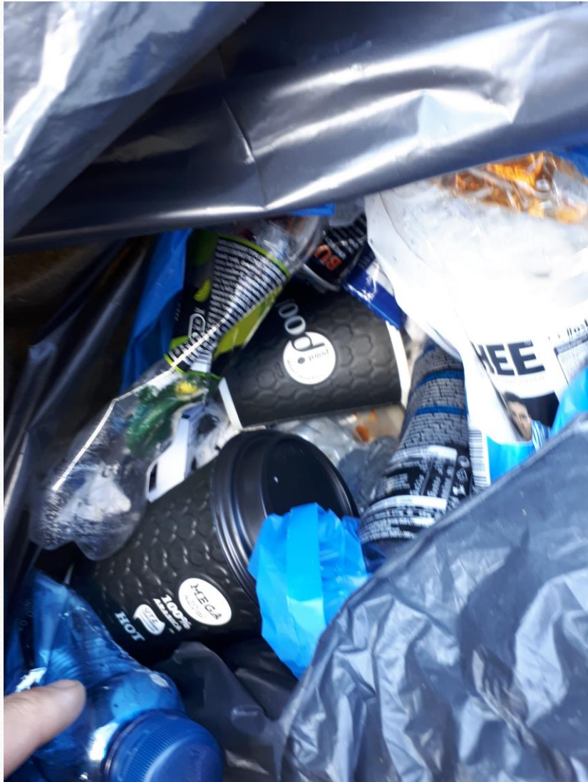
Opracowała Kamilla Frankowska