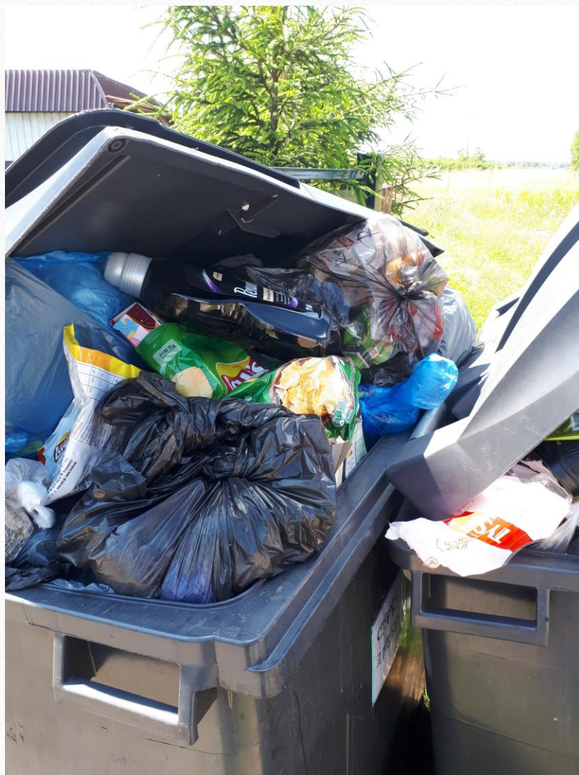
Opracowała Kamilla Frankowska