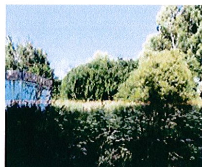
Działka nr 2553