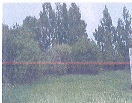
Działka nr 2552